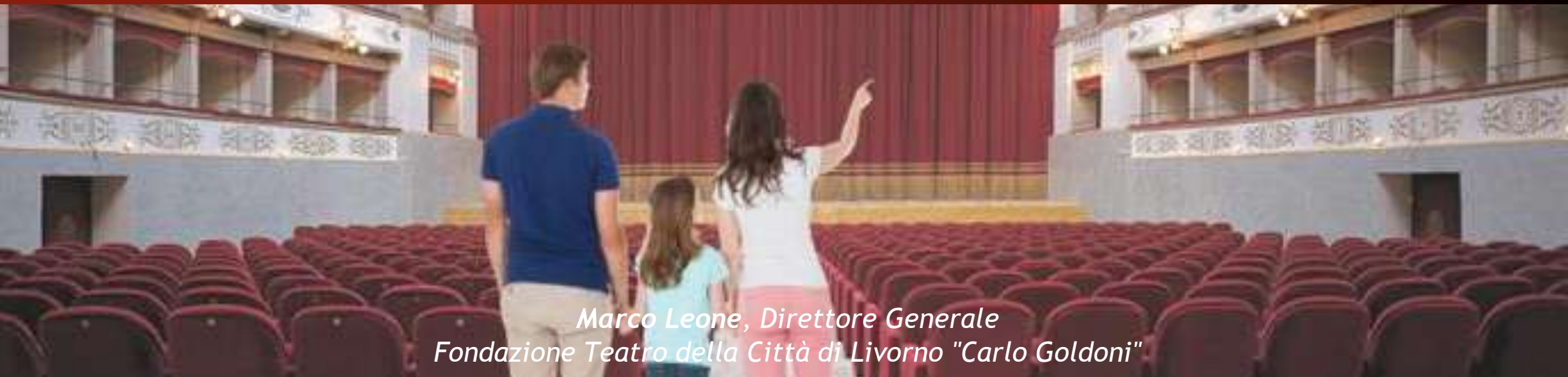
Marco Leone, Direttore Generale Fondazione Teatro della Città di Livorno "Carlo Goldoni"