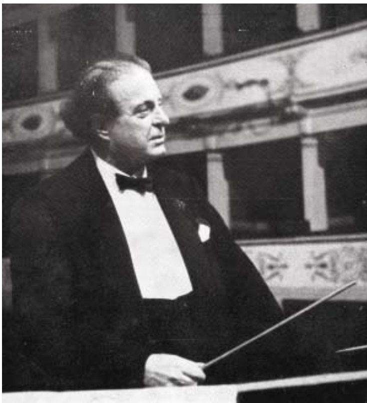
Pietro Mascagni dirige Cavalleria rusticana nel 50° anniversario dell'opera, 1940

livornesi, risultò sempre un punto di riferimento per l'opera di Mascagni, anzi, un suo autentico "regno", nonostante le immancabili lamentele e l'altrettanto inevitabile scontento del musicista. Le serate in onore del musicista, il più delle volte coinvolto come direttore delle proprie opere, costituirono gli appuntamenti fissi dei cartelloni del Teatro: alcuni dei maggiori titoli del suo catalogo (il già citato Silvano , Amica , Isabeau , Parisina , Lodoletta , Parisina , Nerone ) approdarono al Teatro Goldoni, dopo le consacrazioni nei maggiori teatri in Italia e all'estero, sempre con l'Autore sul podio a garantire l'alta qualità esecutiva; solo Guglielmo Ratcliff debuttò tardivamente al Goldoni nel 1903, otto anni dopo il battesimo scaligero, ma l'ultima delle tredici recite del suo lavoro giovanile