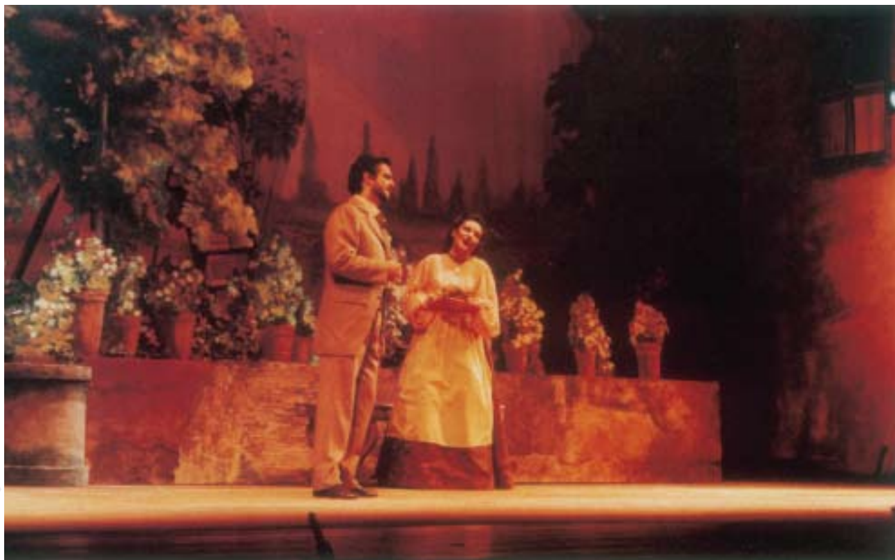
L'amico Fritz , Livorno 1991, Teatro "La Gran Guardia"

panni di Turiddu) e Silvano (1980), ne Le Maschere (1983, nella fortunata e colorata produzione firmata dal regista Giampaolo Zennaro). Poi la forzata chiusura del Teatro e l'esilio delle stagioni liriche del Comitato Estate livornese nel teatro all'aperto di Villa Mimbelli e al Teatro La Gran Guardia, dove a partire dal 1990, anno delle celebrazioni del centenario di Cavalleria rusticana – che verrà diretta nell'occasione da un grande depositario della tradizione operistica italiana, il fiorentino Bruno Bartoletti - il Teatro di Tradizione di Livorno consolida quel Progetto Mascagni che costituisce il punto di partenza di una nuova rinascita di interessi per Mascagni e che vede nuovamente la città natale del musicista come punto di riferimento per una ricognizione esecutiva e critica della sua opera, con le edizioni del