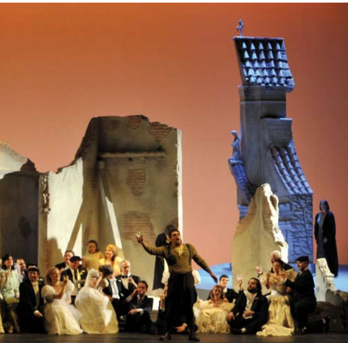
La Cavalleria rusticana nel nuovo allestimento della Fondazione Teatro Goldoni di Livorno nella stagione lirica 2011

del Goldoni: il primo è stato dedicato alla Messa di Gloria , il secondo, intitolato Il bianco manto di Isabeau , è stato dedicato alla ricorrenza del centenario della prima dell'opera mascagnana, con l'esecuzione di alcune delle pagine più importanti della partitura, con Mario Menicagli sul podio, solisti il soprano Silvana Froli e il tenore Nicola Simone Mugnaini. Infine, il 7 dicembre 2012, l'interessante operazione Rapsodia mascagnana , affidata alla fisarmonica di Massimo Signorini e al pianoforte di Diego Terreni: una carrellata di trascrizioni strumentali di pagine tratte