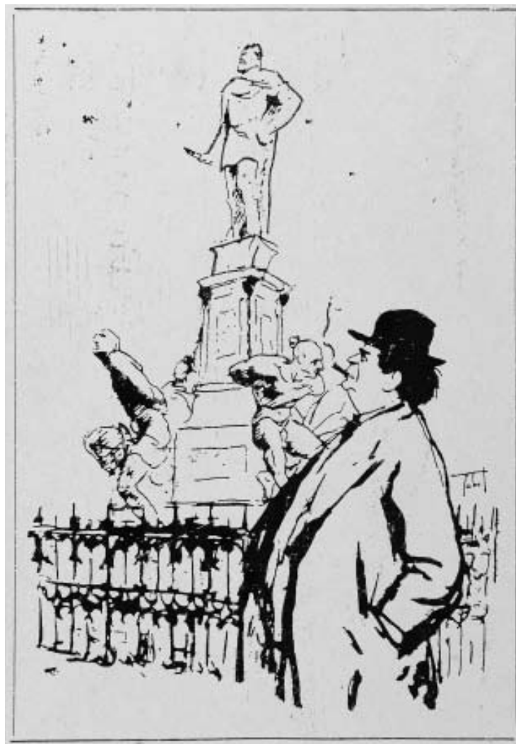
Caricatura di Pietro Mascagni di Tabet

Un rapporto, quello tra Pietro Mascagni e il Teatro Goldoni, destinato a proseguire e a consolidarsi negli anni successivi e nel corso di tutto il Novecento; un rapporto spesso caratterizzato da momenti di crisi, visto il carattere irrequieto e polemico del grande musicista, talvolta incline a mettersi in conflitto con la sua città e con chi vi gestiva la vita teatrale. Si ha spesso la sensazione, leggendo quella inesauribile e preziosa miniera di confessioni e di informazioni che sono i carteggi del Livornese, che Mascagni considerasse Livorno una sorta di sua personale "Bayreuth" e che proprio per questo motivo auspicasse un suo sempre più pieno coinvolgimento nella gestione artistica e organizzativa delle esecuzioni delle proprie opere; com'è noto, Mascagni, nel corso della sua lunga