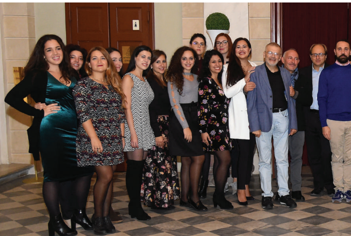
Il cast di Cavalleria rusticana e Suor Angelica