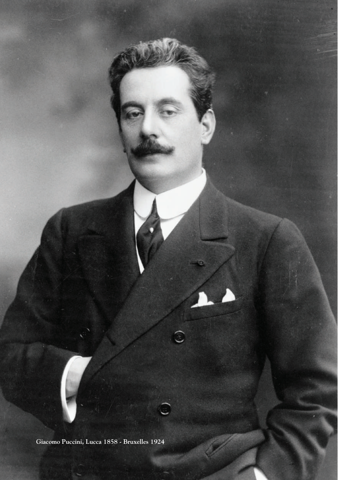
Giacomo Puccini, Lucca 1858 - Bruxelles 1924