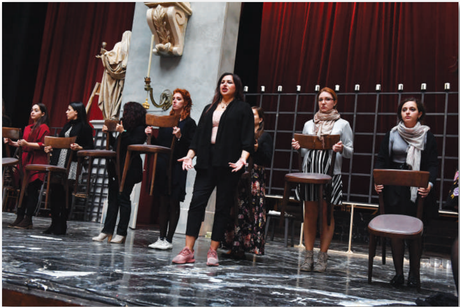
Prove di Cavalleria rusticana e Suor Angelica