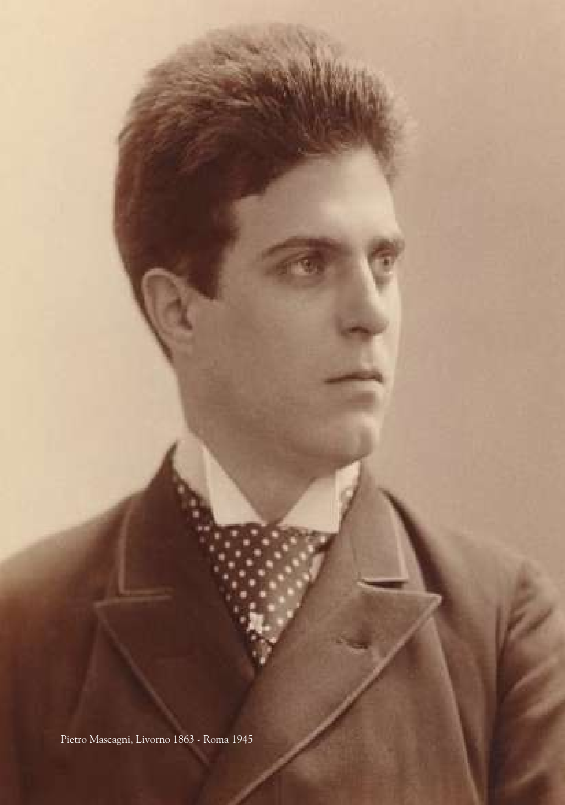
Pietro Mascagni, Livorno 1863 - Roma 1945