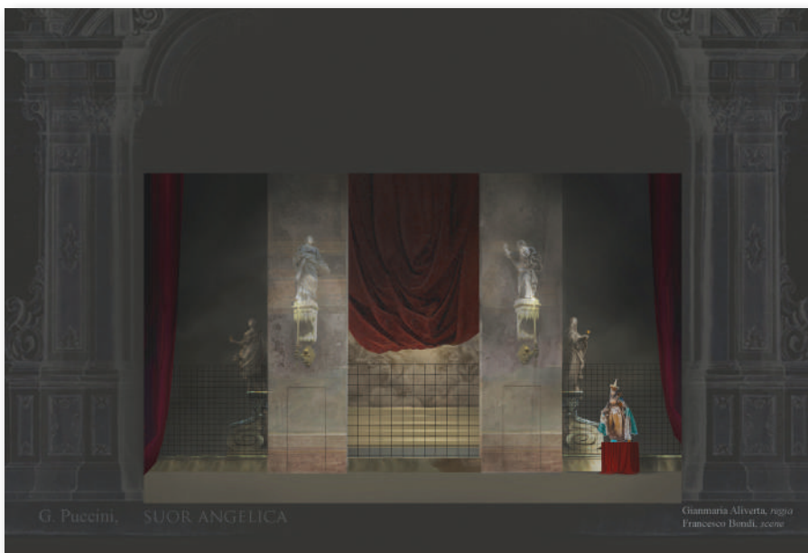
Suor Angelica , bozzetto della scenografia di Francesco Bondi