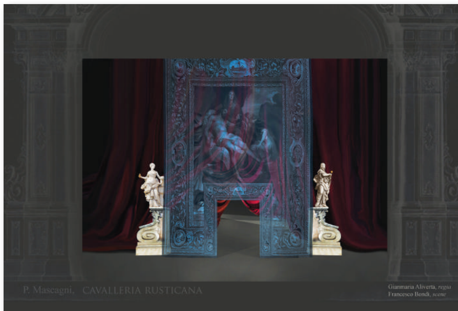
Cavalleria rusticana , bozzetto della scenografia di Francesco Bondi