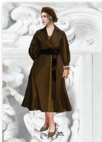
I figurini di Suor Angelica e Zia principessa realizzati dalla costumista Sara Marcucci