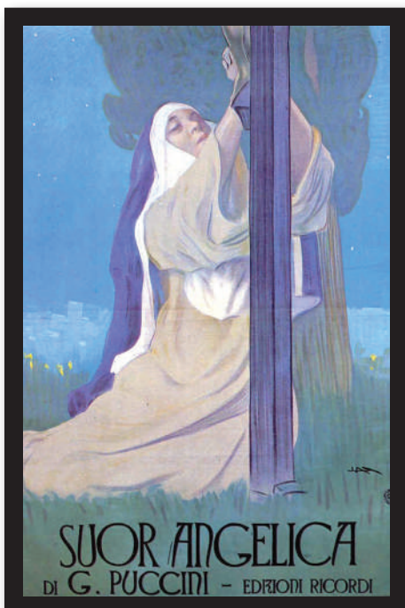
Locandina per la prima rappresentazione di Suor Angelica , 14 dicembre 1918 Metropolitan di New York con Geraldine Farrar, Flora Perini e Minnie Egner