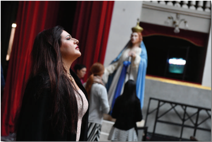
Prove di Cavalleria rusticana e Suor Angelica