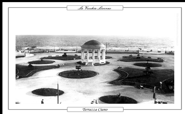
La Vecchia Livorno

La Terrazza Mascagni è uno dei luoghi più eleganti di Livorno si trova sul lungomare, è stata costruita a partire dagli anni venti del novecento, e migliorata nel dopoguerra.