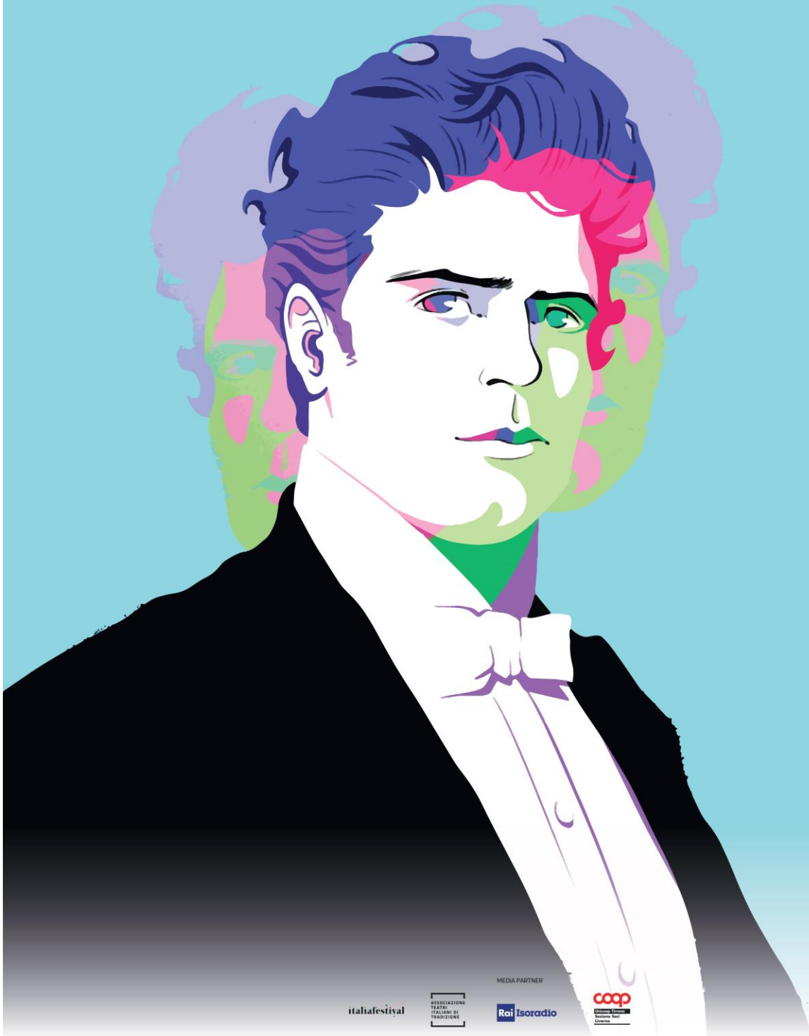
illustrazione di Maddalena Carrai